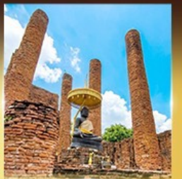
วัดธรรมิกราช