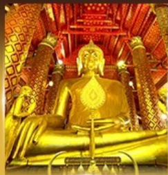
วัดพนมเชิงวรวิหาร