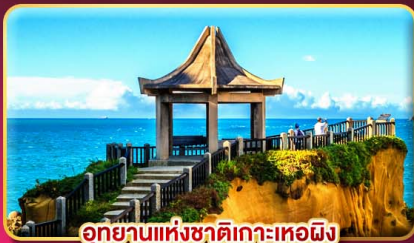
อุทยานแห่งชาติเกาะเหอผิง

ชมพลุข้ามปีฉลองเทศกาลปีใหม่ 2027 แช่น้ำแร่ส่วนตัวในห้องพัก