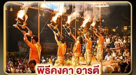
พิธีคองคาอาร์ตี