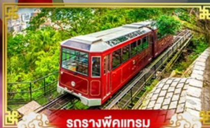
รถรางพิกแรม