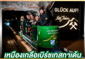
เหมืองเกลือเบียร์เทสกาเดิน