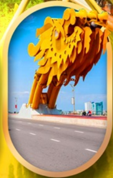
สะพานมังกรคานัง