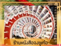
ร้านหนังสือจตุเก๋