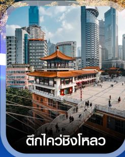
ตึกไคว่ซิงโหลว

✈️ คอนเฟิร์ม ออกเดินทาง ทุกพีเรียด 2 ท่านขึ้นไป