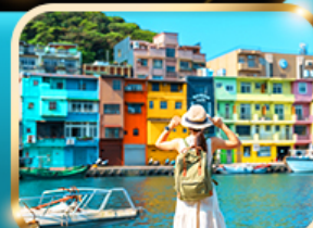
หมู่บ้านประมงจิ้งปิ่น