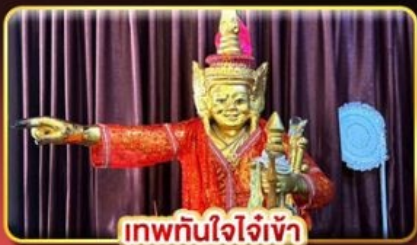
เทพทันใจเจ้าเข้า