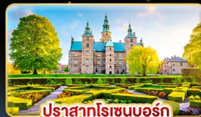
ปราสาทโรเซนบอร์ก