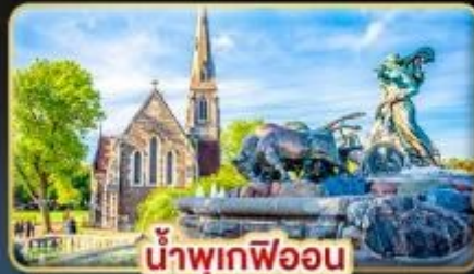
น้ำพุเทพออน