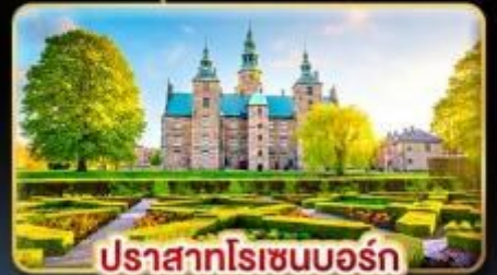
ปราสาทโรเซนบอร์ก