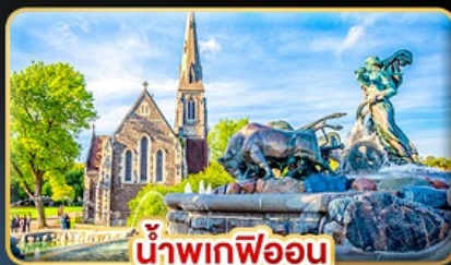
น้ำพุเทพีออน