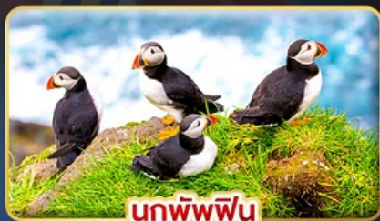
นกพัฟฟิน

📅 เดินทาง : 30 เม.ย. - 07 พ.ค. | 23-30 ก.ค. 69