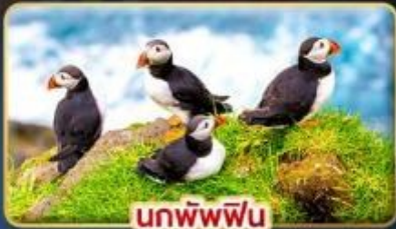
นกพิฟฟิน

📅 เดินทาง : 30 เม.ย. - 07 พ.ค. | 23-30 ก.ค. 69