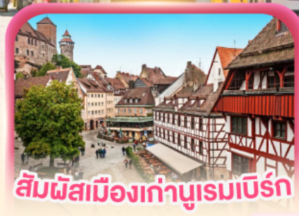
สัมผัสเมืองเก่าบูเรมเบิร์ก