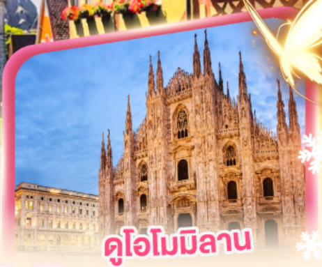
คูโอโมมิลาน