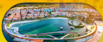
Kiss Bridge สะพานจูบ รวมค่าเข้าสะพานจูบแล้ว