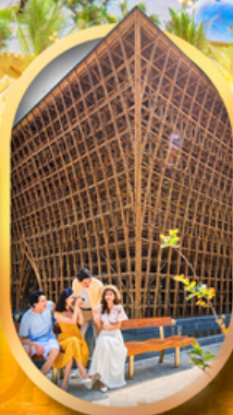
อาคารไม้ไผ่