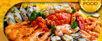
พิเศษเมนูซีฟู้ดบุฟเฟ่ต์ 11 มื้อ เดินทาง มีนาคม 2569