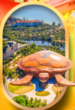
พิพิธภัณฑ์สัตว์น้ำ