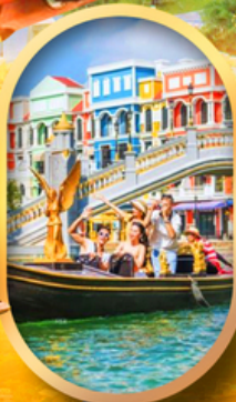
เวนิสแห่งเวียดนาม