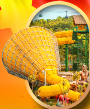
สวนน้ำ Hon Thom