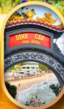
ศาลเจ้าดิงเกา