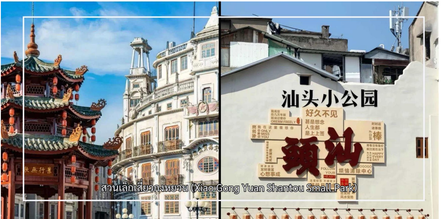
สวนเล็กเสี่ยวกงหยวน (Xiao Gong Yuan Shantou Small Park)

แวะชม สวนเล็กชัวเถา หรือที่รู้จักกันในชื่อ เสี่ยวกงหยวน (Xiao Gong Yuan Shantou Small Park) สถานที่สำคัญทางประวัติศาสตร์และวัฒนธรรมใจกลางเมืองชัวเถา ที่สะท้อนถึงพัฒนาการของเมืองในช่วงการเปิดท่าเรือการค้าในอดีต พื้นที่แห่งนี้เคยเป็นศูนย์กลางความเจริญและกิจกรรมทางสังคมของชุมชนมาอย่างยาวนาน บริเวณโดยรอบสวนรายล้อมด้วยอาคารสไตล์จีนผสมตะวันตกอันเป็นเอกลักษณ์ แสดงถึงอิทธิพลทางสถาปัตยกรรมจากยุคการค้าระหว่างประเทศ