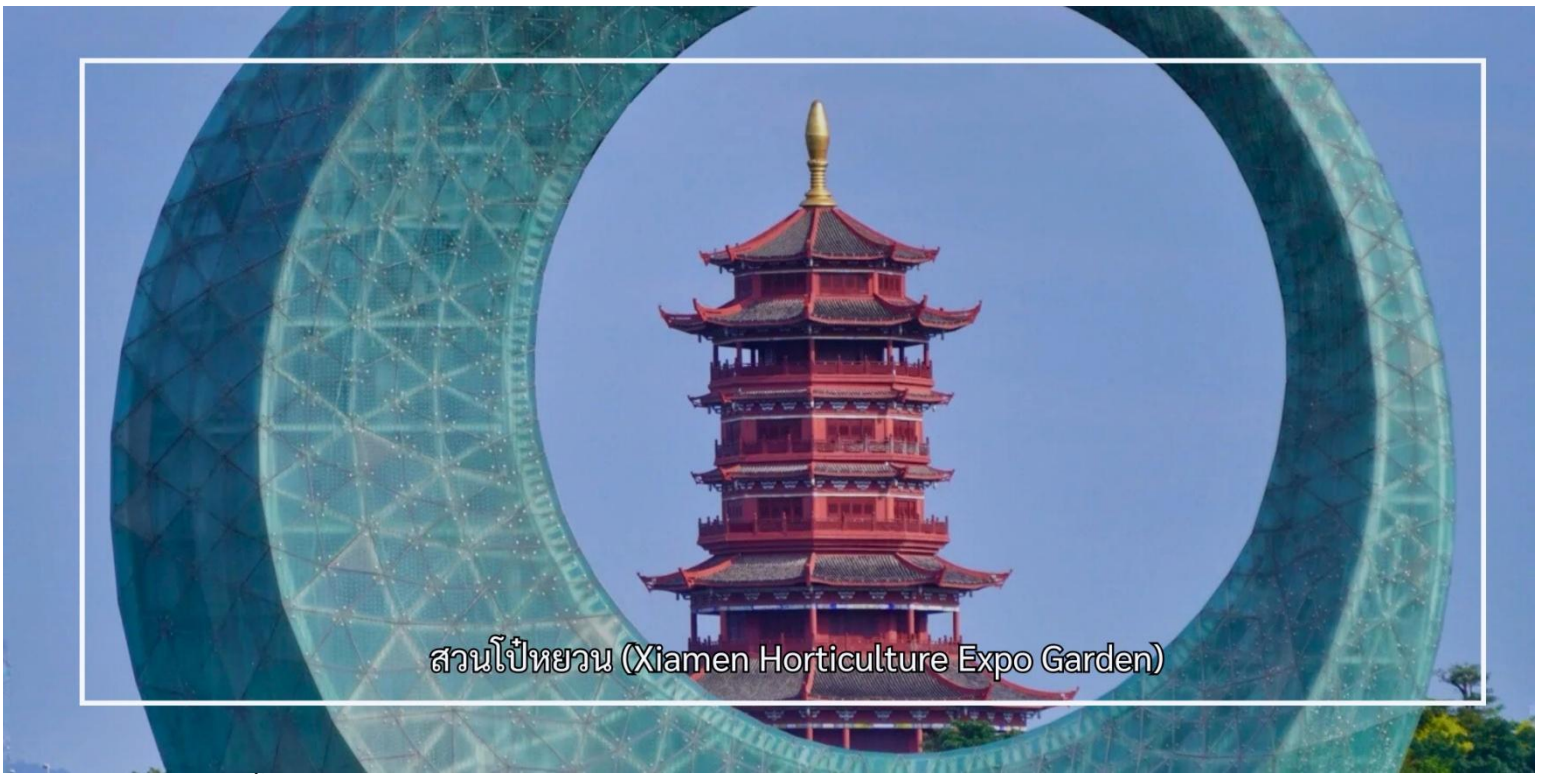
สวนโป๋หยวน (Xiamen Horticulture Expo Garden)

จากนั้นชม หอชมวิวไข่มุกทะเล (Sea Pearl Observation Tower) เป็นจุดชมวิวที่โดดเด่นและเป็นสัญลักษณ์สำคัญของเมือง ด้วยความสูงประมาณ 195 เมตร หอชมวิวแห่งนี้เปิดมุมมองทัศนียภาพแบบ 360 องศา ให้ผู้มาเยือนได้ชมความงดงามของเมืองเซี่ยเหมิน ชายฝั่งทะเล และภูมิทัศน์โดยรอบอย่างเต็มตา และเก็บภาพความประทับใจของเมืองท่าที่มีเสน่ห์แห่งนี้ จากนั้นเพลิดเพลินกับประสบการณ์ความบันเทิงที่ โรงภาพยนตร์โกลบอล ซึ่งนำเสนอภาพยนตร์และสื่อมัลติมีเดียทันสมัย ถ่ายทอดเรื่องราวและวัฒนธรรมของเมืองในรูปแบบที่น่าสนใจ ช่วยเติมเต็มการท่องเที่ยวให้ทั้งได้ชมวิวก่อน และเรียนรู้ไปพร้อมกัน