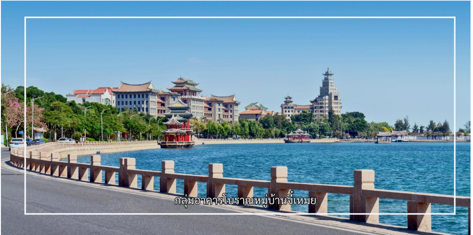
กลุ่มอาคารโบราณหมู่บ้านจีเหมย

นักธุรกิจและนักการศึกษาผู้มีชื่อเสียง ซึ่งมีบทบาทสำคัญในการพัฒนาพื้นที่จีเหมยให้เป็นศูนย์กลางด้านการศึกษา และวัฒนธรรม สถาปัตยกรรมของหมู่บ้านจีเหมยมีลักษณะเฉพาะ เรียกว่า “สไตล์จีเหมย” ซึ่งเป็นการผสมผสานระหว่างศิลปะจีนดั้งเดิมกับอิทธิพลตะวันตก หลังคาทรงจีน ผนังอิฐสีอ่อน ชุ่มประตู่ และรายละเอียดการตกแต่งที่ประณีต สะท้อนถึงความงดงามและคุณค่าทางประวัติศาสตร์อย่างชัดเจน พื้นที่ภายในประกอบด้วยอาคารเรียน วัด ศาลา และบ้านพักที่จัดวางอย่างเป็นระเบียบ สอดคล้องกับภูมิทัศน์โดยรอบ