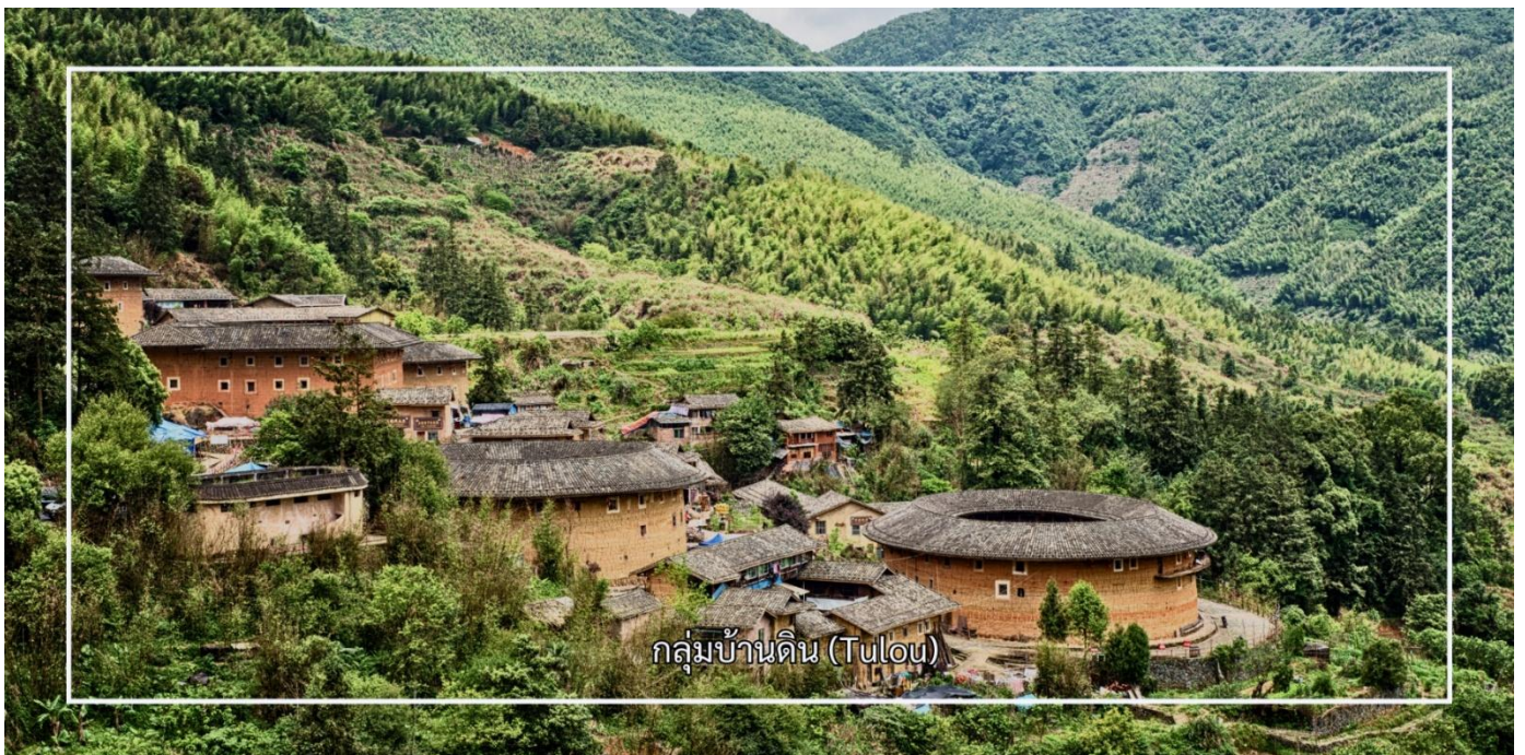
กลุ่มบ้านดิน (Tulou)

เที่ยง รับประทานอาหารเที่ยง ณ ภัตตาคาร (มื้อที่ 3)