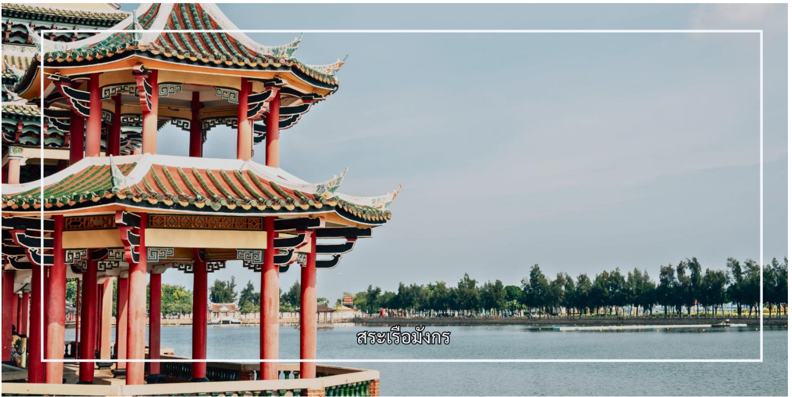
สระเรือมังกร

ค่ำ รับประทานอาหารค่ำ ณ ภัตตาคาร (มื้อที่ 1) จากนั้นเดินทางเข้าสู่โรงแรมที่พัก Xiamen Liyi Hotel ระดับ 4 ดาวหรือเทียบเท่า