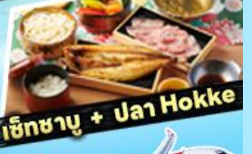
เซ็ทซาซุ + ปลา Hokke

36,919 ราคา เริ่มต้น บาท รวมภาษีมูลค่าเพิ่ม 7%