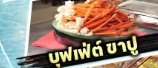
บุฟเฟต์ ชาบู