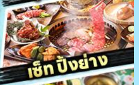
เซ็ท บิงยัง