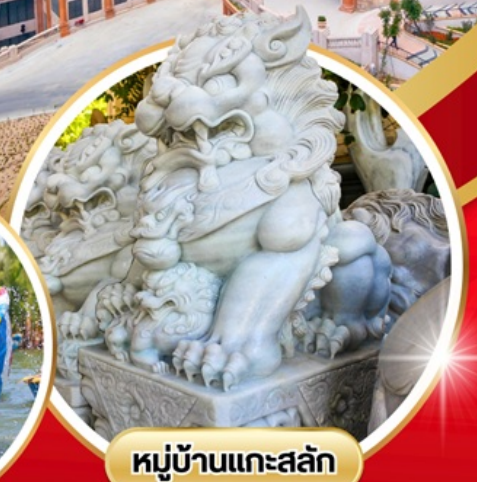
หมู่บ้านแกะสลัก