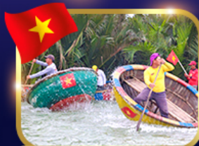
ล่องเรือกระดัง หมู่บ้านกิมถาน