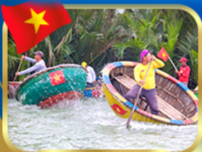
ล่องเรือกระดุง