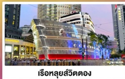
เรือทูลย์สวีตตอง