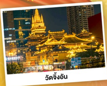
วัดจิ้งอัน