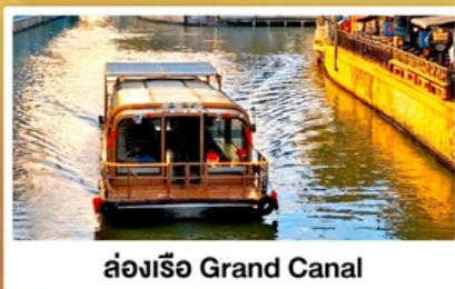
ล่องเรือ Grand Canal