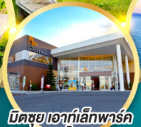
มีตชยุ เอทท์ เล็ก พาร์ค คาโดมะ