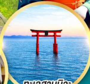
ทะเลสาบบิวะ เสาโทริอิ

เส้นทางสายอัลไพน์ทาเคยาม่า กำแพงหิมะ เขื่อนคุโรเบะ