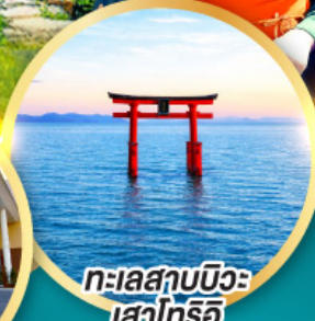
ทะเลสาบบิวะ เส้าโทริอิ