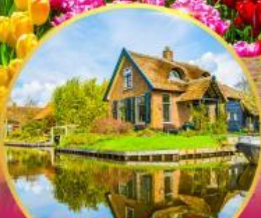
หมู่บ้านที่รูรัน