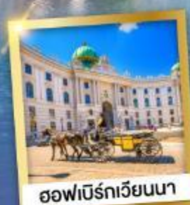
ฮอฟบวร์กเวียนนา