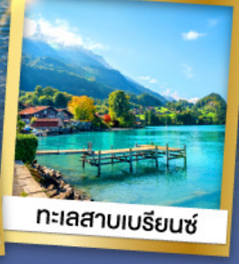
ทะเลสาบเบรีนซ์