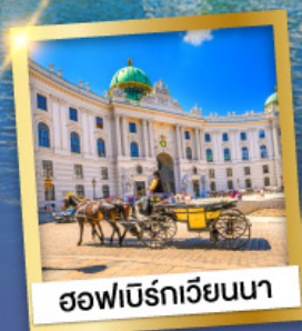
ฮอฟบวร์กเวียนนา