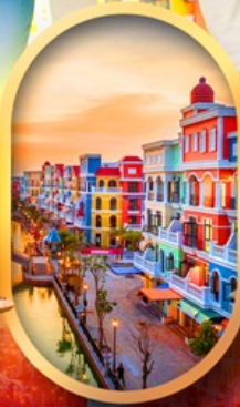
เวนิสแห่งเวียดนาม