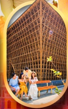
อาคารไม้ไฟ