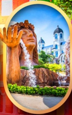
น้ำตกเทพหญิง