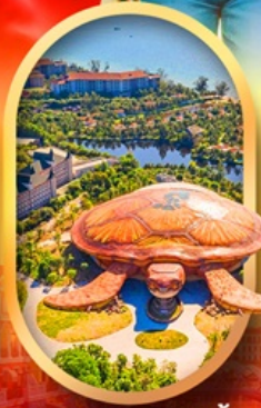
พิพิธภัณฑ์สัตว์น้ำ