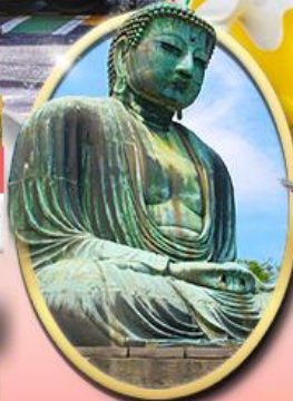
พระใหญ่คามาคุระ