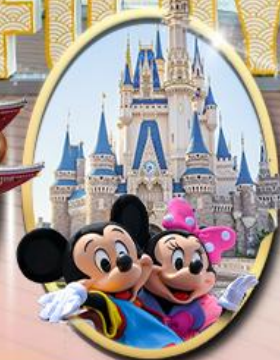
อิสระเลือกซื้อบัตร Tokyo Disneyland