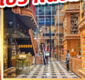
ร้านไอศกรีมมียาฮาร่า