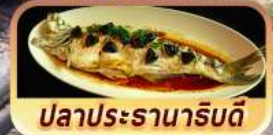
ปลาประจานาริบดี