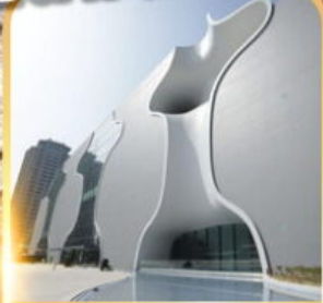
โรงละครโดง