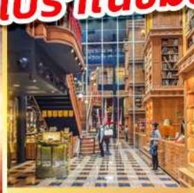
ร้านไอศกรีมมียาฮาร่า