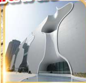
โรงละครโดง