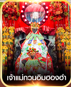
เจ้าแม่กวนอิมองค์