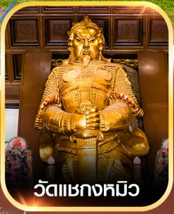
วัดแซกกงหิว

✈️ คอนเฟิร์มออกเดินทาง ทุกพีเรียด 2 ท่านขึ้นไป