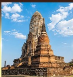
วัดราชบูรณะ