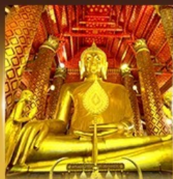
วัดพนัญเชิงวรวิหาร