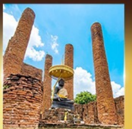
วัดธรรมิกราช