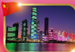
No.3 Bathing Beach