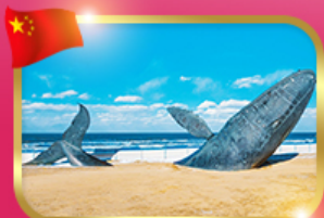
ประติมากรรมวาฬเกยตื้น