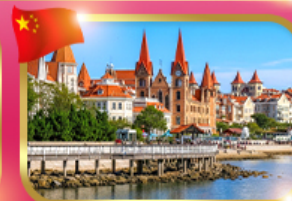
ทำเรือประมวโห่ซาง เขียนโต