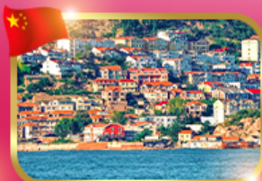
ชมวิวกุ๋มบ้านประม ซาจิ้อ่ว