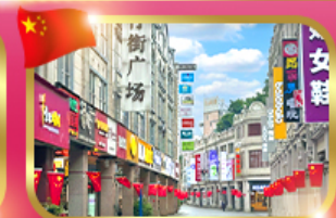
ช้อปปิ้ง ถนนคนเดินเจาหยาง