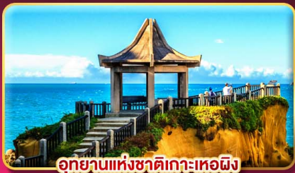
อุทยานแห่งชาติเกาะเหตง