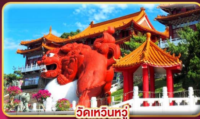
วัดหนิวหนี่