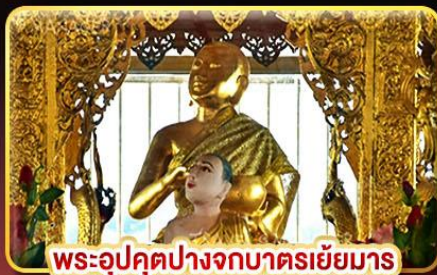
พระอุปคุตปางจากบาตรเขี่ยมาร