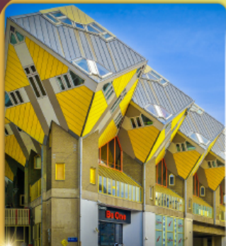
บ้านลูกเต๋า โค้คคูมูส

“ล่องเรือหลังคากระจก” ชมกรุงอัมสเตอร์ดัม