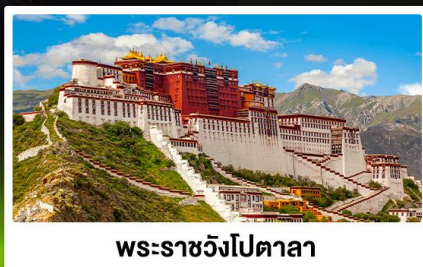
พระราชวังโปตาลา