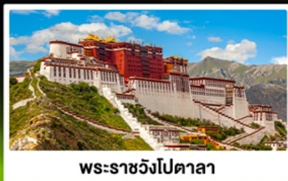
พระราชวังโปตาลา