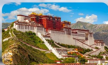
พระราชวังโปตาลา