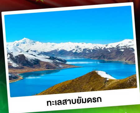
ทะเลสาบยัมดรก