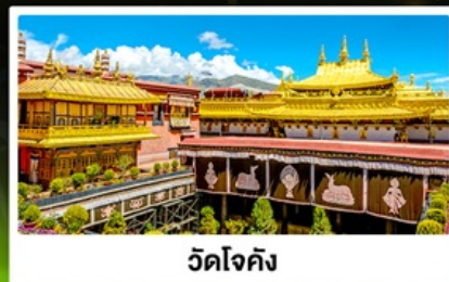
วัดโจคัง