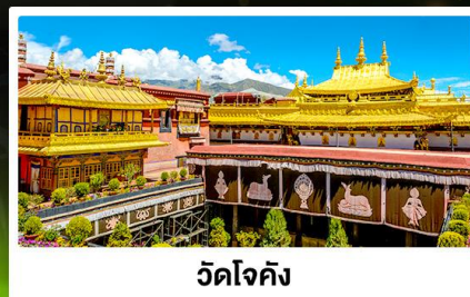
วัดโจคัง