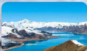
ทะเลสาบยิมดรก