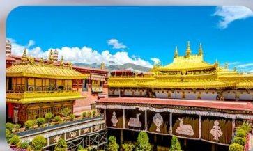
วัดโจคัง