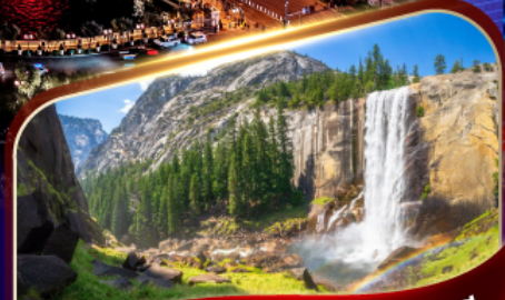
อุทยานแห่งชาติโยเซมิตี