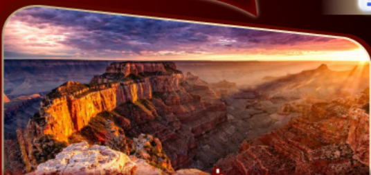
แกรนด์แคนยอนฝั่งตะวันตก

พิกลาสเวกัส 2 คืน เต็มอิ่มกับแสงสีแห่งอเมริกา