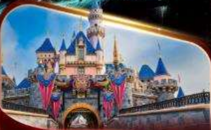
ดิสนีย์แลนด์ปาร์ค