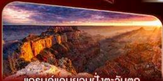
แกรนด์แคนยอนฝั่งตะวันตก

พักลาสเวกัส 2 คืน เต็มอิ่มกับแสงสีแห่งอเมริกา