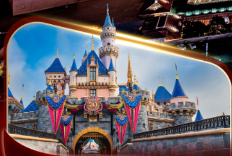
ดิสนีย์แลนด์ปาร์ค