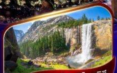
อุทยานแห่งชาติโยเซมิตี