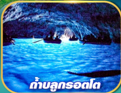
ถ้ำบลูกรอดโด