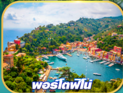
พอร์โตฟีโน