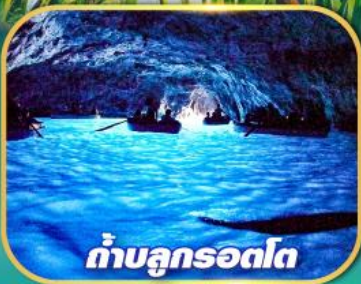
ถ้ำบลูกรอตโต