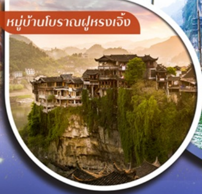
หมู่บ้านโบราณฝูหลงเจิ้ง

คอนเสิร์ตออกเดินทาง ๕ ตั้งแต่ 10 ท่าขึ้นไป