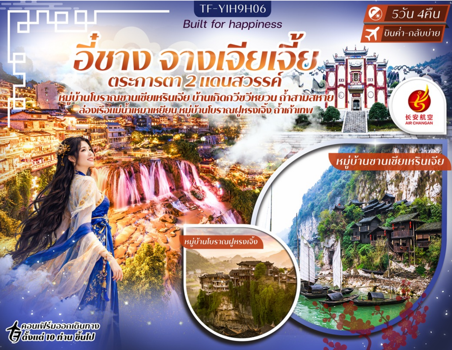
หมู่บ้านชานเซี่ยเหรินเจีย