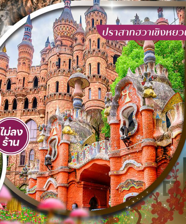
ปราสาทอวาเชิงหยวน