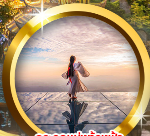
กระจกแห่งท้องฟ้า