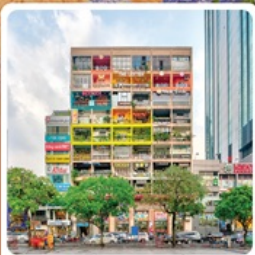
คาเฟ่ อพาร์ทเม้น