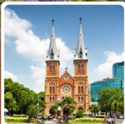
โบสถ์นอร์ทเทรอดาม