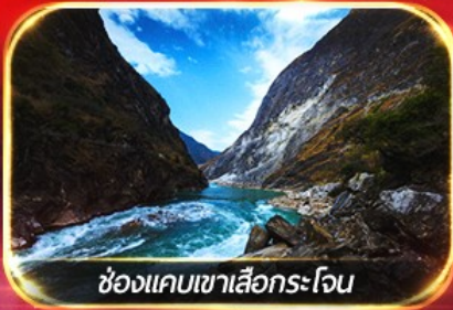
ช่องแคบเขาเสือกระโจน