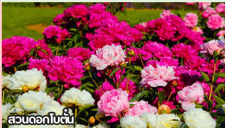
สวนดอกโบตั๋น

เดือนสิงหาคม-ต้นกันยายน ชมทุ่งดอกเบญจมาศหรือดอกไฮเดรนเยีย ดอกเบญจมาศปักกิ่งหมายถึงสายพันธุ์เบญจมาศที่มีต้นกำเนิดหรือนิยมปลูกในกรุงปักกิ่ง ประเทศจีน โดยเฉพาะช่วงฤดูใบไม้ร่วง ที่มีการจัดงานมหกรรมดอกเบญจมาศ แสดงความหลากหลายของสีและรูปร่าง มีสายพันธุ์เช่น "กุส่วยจินเสี" ที่ได้รับรางวัลราชาดอกเบญจมาศ และยังมีเบญจมาศปักกิ่งสีขาวที่เป็นสมุนไพรด้วย ที่สำคัญคือเป็นดอกไม้ที่ใช้ในงานเทศกาลและวัฒนธรรม โดยเฉพาะในสวนสาธารณะ เช่น รื่อถาน และอุทยานเป่ย์ไห่ มีหลากหลายสี เช่น ขาว เหลือง ชมพู แดง และม่วง สามารถพบได้ในหลายพื้นที่