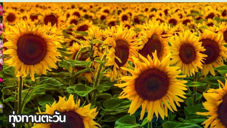
ทุ่งทานตะวัน

จากนั้นนำท่านสู่ ถนนหวังฝูจิ่ง ถนนคนเดินสุดฮิตใจกลางกรุงปักกิ่ง ปัจจุบันถนนนี้เป็นที่นิยมมากในหมู่นักช้อปปิ้งและนักท่องเที่ยวที่ตบเท้าเข้ามาเพื่อเสาะหาของลดราคาและเสื้อผ้าที่มีเอกลักษณ์ไม่ซ้ำใคร ถนนการค้าที่พลุกพล่านแห่งนี้มีมีม้านั่ง บาร์ ร้านอาหาร