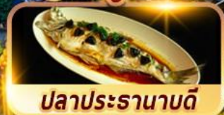
ปลาประรานาบดี