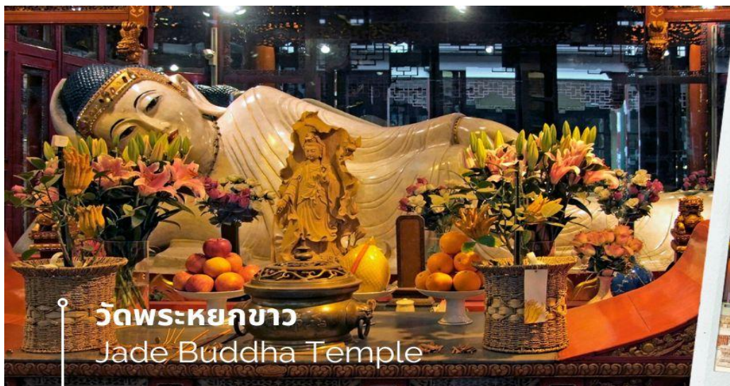
วัดพระหยกขาว Jade Buddha Temple

เช้า 📍 รับประทานอาหารเช้า ณ ห้องอาหารโรงแรม (12) นำท่านชม วัดพระหยกขาว เป็นวัดที่มีชื่อเสียงมากที่สุดในเมืองเชียงใหม่ ซึ่งเป็นที่รู้จักจากพระพุทธรูปสององค์ที่สร้างขึ้นจากหยกทั้งแท่ง องค์พระพุทธรูปปางนั่งมีความสูง 190 เซนติเมตร และ หุ้มด้วยเพชรพลอย หิน มโนรา และ