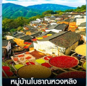
หมู่บ้านโบราณหวงหลิง (หมู่บ้านเทพพรัก)