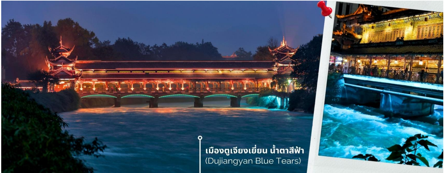
เมืองตูเจียงเยียน น้ำตาสีฟ้า (Dujiangyan Blue Tears)

ค่ำ 📍 รับประทานอาหารค่ำ ณ ภัตตาคาร (6) 🚗 นำท่านเดินทางเข้าที่พัก SHANG HE CHEN YUE HOTEL 4 ดาวหรือเทียบเท่า