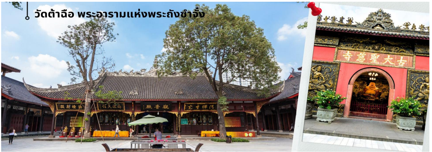
วัดต้าฉือ พระอารามแห่งพระถังซำจั๋ง

นำท่านเดินทางกลับเจียงตู นำท่านชม วัดต้าฉือ พระอารามแห่งพระถังซำจั๋ง ใจกลางนครเจียงตู พระถังซำจั๋ง ได้รับการสรรเสริญว่าเป็นผู้มีความเพียร และมีชื่อเสียงมายาวนานกว่า 1,400 ปี และยังได้รับการยกย่องว่าเป็นพระไตรปิฎกแห่งราชวงศ์ถัง พุทธประวัติของพระถังซำจั๋งถูกจารึกในสถานที่ต่างๆ มากมาย รวมไปถึงได้ถูกกล่าวถึงในจดหมายเหตุหลายเล่ม ตามเส้นทางการเดินทางแห่งความเพียรของท่าน รวมทั้งมีพระอัฐิของท่าน ประดิษฐานอยู่ในพระอารามของนครนานจิง และที่ทะเลสาบสุรียันจันทราเป็นเกาะใต้หวั่นอีกด้วย