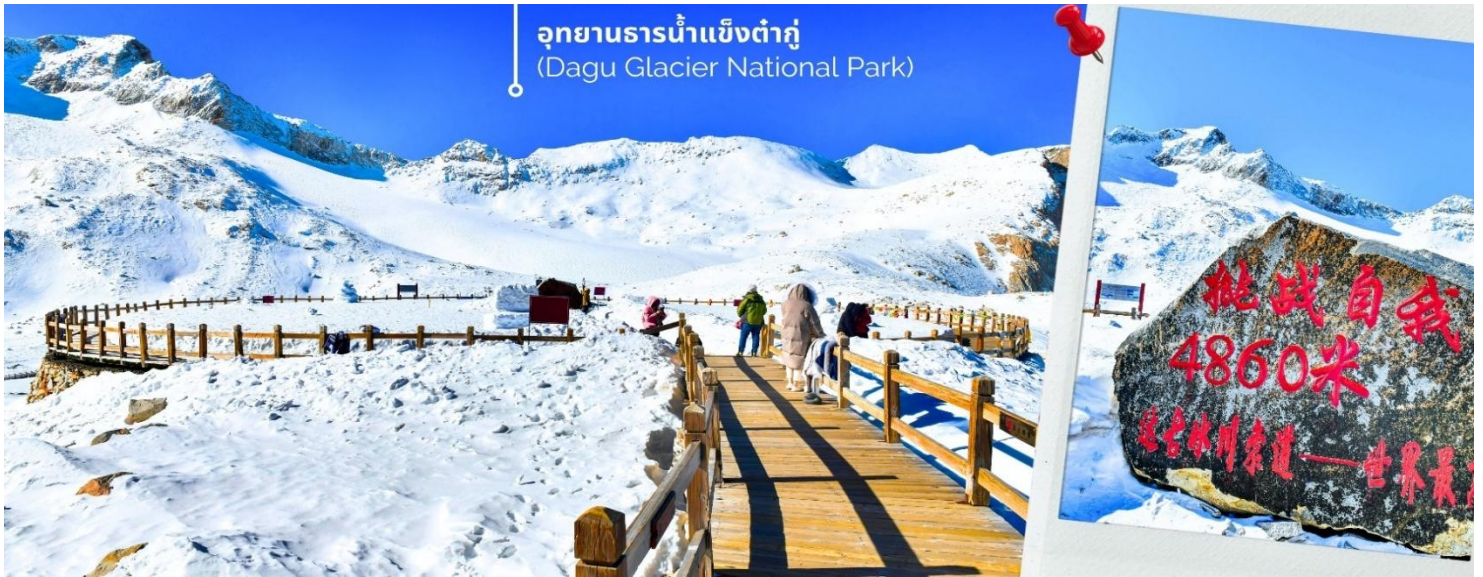
การตกและความหนาวของหิมะขึ้นอยู่กับสภาพอากาศ

จากนั้นนำท่านเดินทางสู่ เมืองเฮยลู่ (ใช้เวลาเดินทางประมาณ 2 ชั่วโมง) เพื่อเดินทางไปยัง อุทยานธารน้ำแข็งต้ากู่ปิงชวน(รวมกระเช้าขึ้นลง) ต้ากู่ปิงชวน หรือ Dagu Glacier National Park เป็นธารน้ำแข็งกลาเซียร์ที่สวยงามที่สุดแห่งหนึ่งของโลก และเป็นสถานที่ท่องเที่ยวระดับ 4A ของจีน ตั้งอยู่ที่เมืองเฮยลู่ ในมณฑลเสฉวน ห่างจากเมืองเฉิงตูประมาณ 300 กิโลเมตร ถือเป็นธารน้ำแข็งที่อายุน้อยที่สุด ที่ตั้งอยู่ในระดับความสูงที่ต่ำที่สุด และอยู่ใกล้กับเมืองมากที่สุดในบรรดาธารน้ำแข็งทั้งหมด โดยอยู่สูงจากระดับน้ำทะเลประมาณ 3,800-5,100 เมตร จุดสูงที่สุดที่นักท่องเที่ยวสามารถขึ้นไปได้จะอยู่ที่ 4,860 เมตร