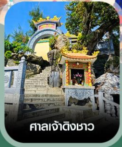
ศาลเจ้าดิงขาว