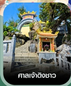
ศาลเจ้าดิ้งขาว