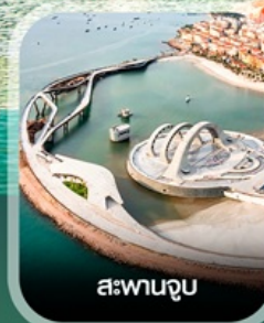
สะพานจูป

คอนเฟิร์ม ออกเดินทาง ทุกพีเรียด 2 ท่านขึ้นไป