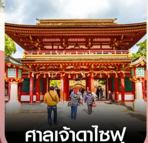
ศาลเจ้าดาไซฟู