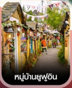
หมู่บ้านยูฟูอิน