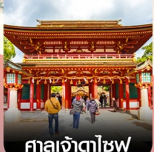
ศาลเจ้าตาไซฟู