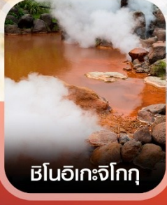
ฮิโนอิเคะจิกุ

✈️ คอนเฟิร์มออกเดินทาง ✈️ ทุกพีเรียด 2 ท่านขึ้นไป