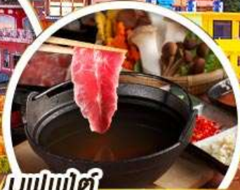
บุฟเฟ่ต์ ซาบูทมิ้อไฟโตทวัน