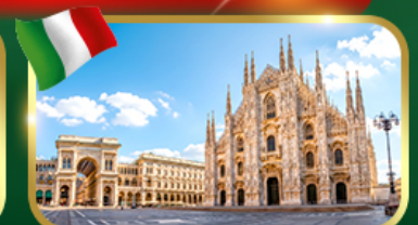
เช็กอิน มหาวิหารดูโอโมแห่งมิลาน