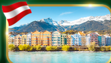
อินส์บรุค เมืองสวยเทือกเขาแอลป์