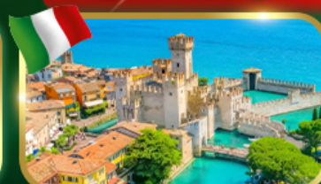
เมืองสวยริมทะเลสาบ เซอร์มิโอเน่