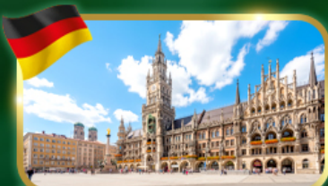
เช็กอิน จัตุรัสมาเรียนพลัทซ์