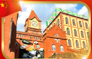
เข็คอิน พืพืรณทที่บียร์ซิงเต่า