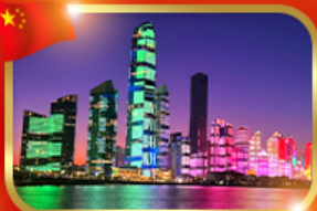
No.3 Bathing Beach ทะเลซิงเต่า