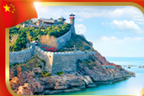
ศาลาเหมิงโหล เมืองซานตง