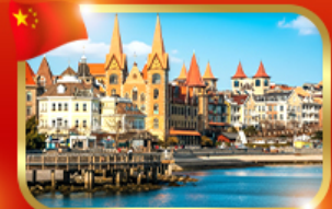
ท่าเรือฟิชชอร์แมนไห่ซาง