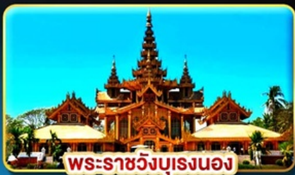
พระราชวังบุเรงนอง

สักการะ มหาบุชาสถานอันศักดิ์สิทธิ์ ที่ต้องห้ามพลาด