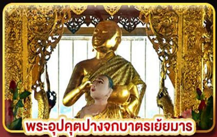
พระอุปคุตปางจกบาตรเขี่ยมาร