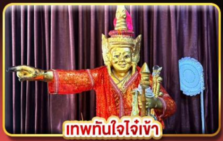
เทพทันใจใจเจ้า

8,999.- ราคาเริ่มต้น เดินทาง พ.ค.-ต.ค.69